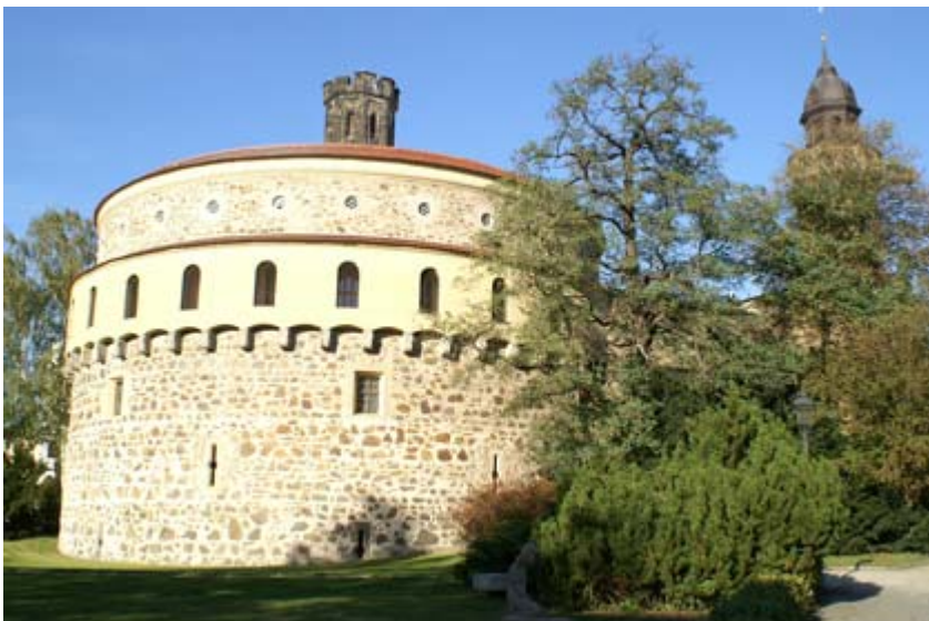
Kaisertrutz, Görlitz, Ausstellungsort der 3. Sächsischen Landesausstellung „via regia“